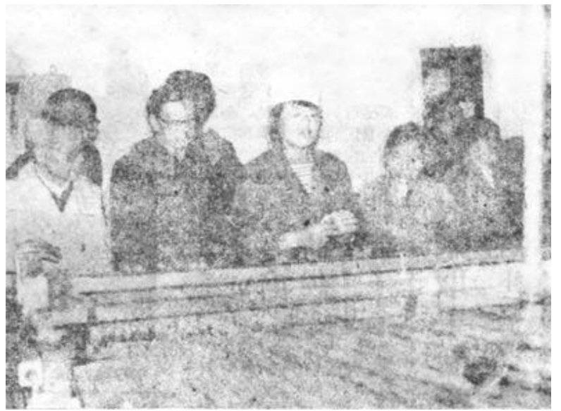
4月29日下午，石油大学民盟支部、九三学社、政协组织部分教师到市棉纺厂参观了解东营市轻工业的发展情况。图为老师们在车间参观。

商业局去年先在市百货大楼进行消费者评估试点，取得了比较好的效果。4月29日，全市商业系统召开评估企业现场会，切实抓好消费者评估企业活动。(超 常)