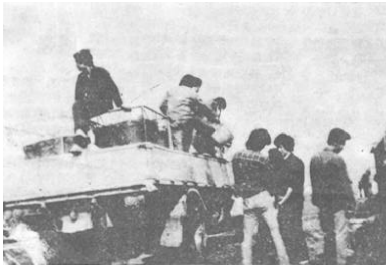
为促进我市对虾养殖的大力发展，各县区育苗厂孵化了大批虾苗。图为垦利县育苗厂的虾苗正在紧张地装车外运。